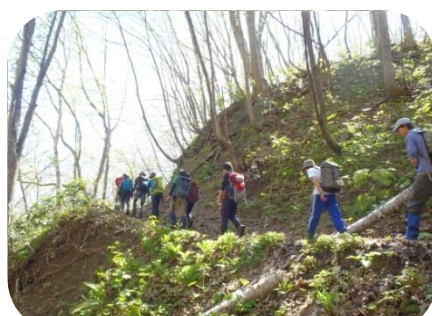
登山道もすっかり春めいてきました