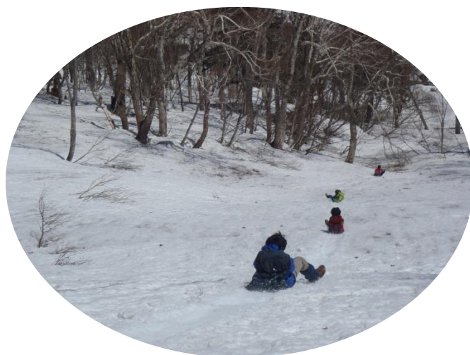
尻滑りを楽しみました