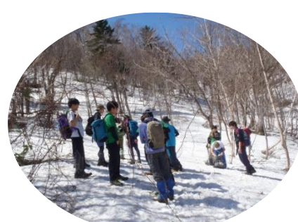
土場周辺からは残雪