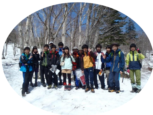
偶然の再会 K さんとの記念写真