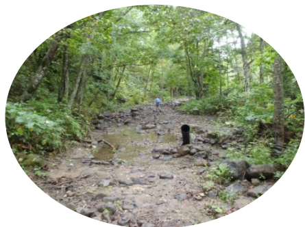
林道土砂流入行き止まり

1年部員2名、2年部員4名、顧問2名で道央圏の登山者に愛される空沼岳を登ってきました。2学期中間考査終了の翌日でしたが、身体の鈍った部員にとってリフレッシュできる山行になりました。2年ほど前の大雨で林道が崩壊し、以前の駐車場の300mほど手前で駐車。スタート地点の橋も無くなり、登山道も修理した箇所が所々見られたものの、大きな石が流れ込んだ場所もあり、全体に以前より荒れていました。登山者の数も以前より大分減ってしまったようです。しかし、万計沼や真簾沼は相変わらず美しい姿のまま残っていました。万計山荘も友の会の尽力で、以前と同じように登山者を迎えてくれていました。部員達は沼の姿や山頂で雲の切れ間から見た風景に癒され、暫くぶりの気持ち良い汗をかいて徐々に秋へと向かう山を楽しんできました。