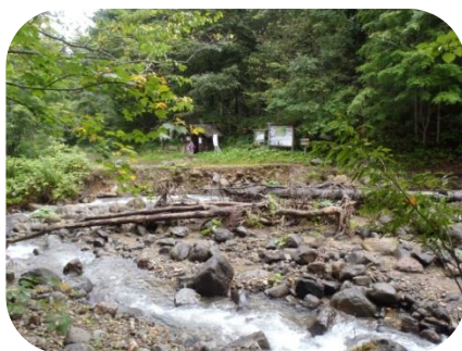
登山口への橋は跡形もなし