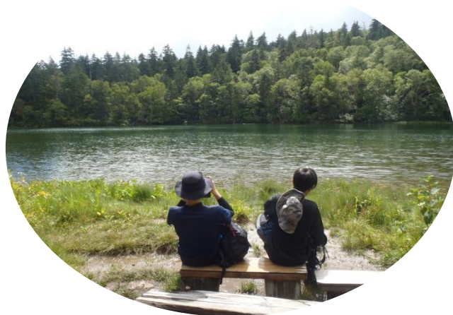
万計沼に癒されます