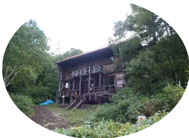
万計山荘はしっかり管理されています