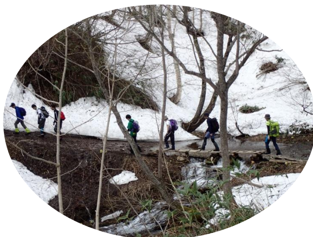
渡渉し山頂へ向かいます