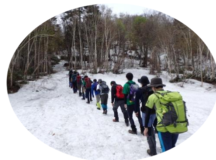
土場からは残雪の上を歩きます