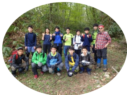
登山口で記念写真

部員12名+顧問2名で例年通り春を探しに春香山へ行ってきました。恵まれた好天の中、途中にはイソイソ、カクレ、ニソソ、ヒメガ、汚初、イソ、ルウツカなど様々な春の花が出迎えてくれました。銀嶺荘の管理人さんは、水は足りてるか？道に迷うなよ。と色々と気遣ってくれました。山頂からは小樽～石狩の海岸線がよく見えました。3月に登った和宇尻山もすぐ横に見えました。上級生部員は残り少ない部活動期間を惜しみながら最後の尻滑りを楽しみました。3時間近い登りの山行でしたが、1年生男子5名は足取りもしっかりしていて大変頼もしかった。今後が楽しみです。下山後、短い反省交流会で親睦を深めた1日でした。