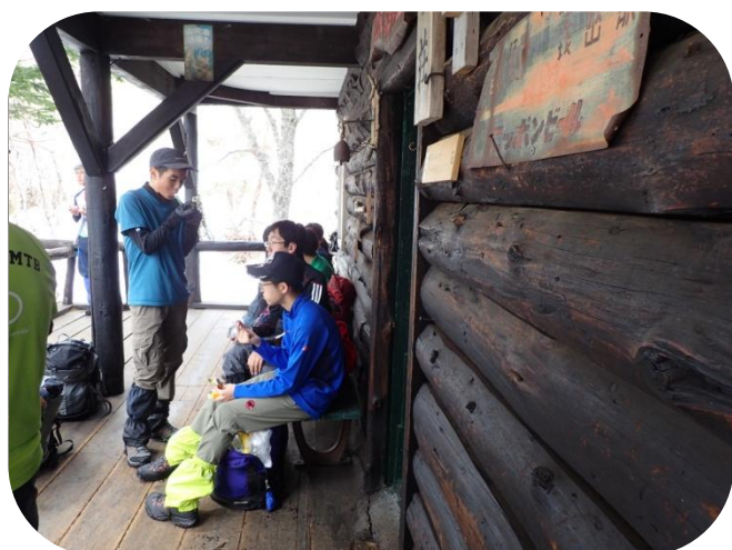
銀嶺荘で少し休憩