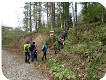
林道から登山道へ