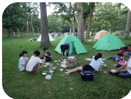
鹿も加加 知床国設キャンプ場