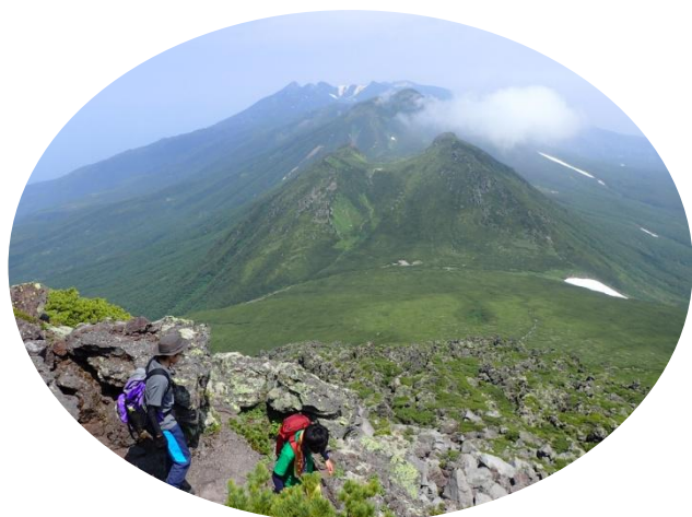
知床連山が奥まで見渡せます