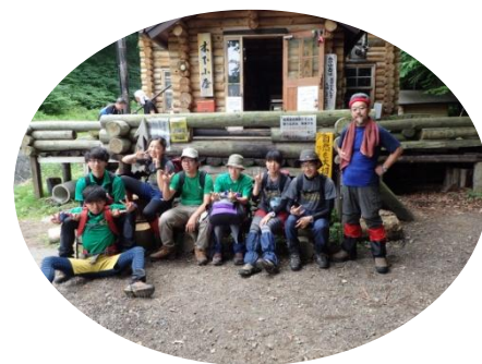
出発前、木下小屋で記念写真