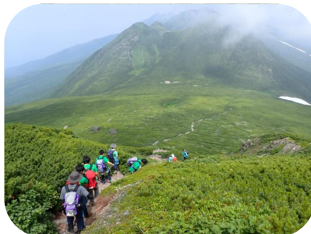
世界自然遺産の雄大な風景を満喫