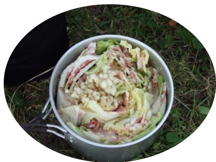
キャンプの新メニュー 豚肉ミルフィーユ

本年度の卒業山行は、世界自然遺産知床の羅臼岳を外側から岩尾別コースを登って来ました。小樽ではゲズデ沖が床上浸水するという大雨に見舞われたようでしたが、我々の山行中は下山の最後で雨に当たったくらいで、ほぼ快晴の中素晴らしい風景を満喫した山旅となりました。1日目は知床まで移動し国設キャンプ場テ泊。鹿が近くで加加する中、夕食は工夫を凝らしたメニューで豪勢でした。2日目は羅臼岳登山。木下小屋をいざ出発。登山道沿いには多くの種類の花が咲き、目を楽しませてくれました。暑さと往復8時間弱の長時間山行に悪戦苦闘しましたが、その苦労に値するだけ山頂からの知床連山の風景は圧巻でした。3年生は高校生活最後の登山を満足感と充実感の中で終わることができました。下山後雨の中清里のオートキャンプ場に移動し、翌日雨の中早朝からの移動に備えてテ泊。入浴・夕食後にミーティング。部員達は、3年間の山岳部での思い出を熱く語り合いました。3日目は早朝より移動し、札幌円山球場に直行。野球全道大会の全校応援に合流しました。