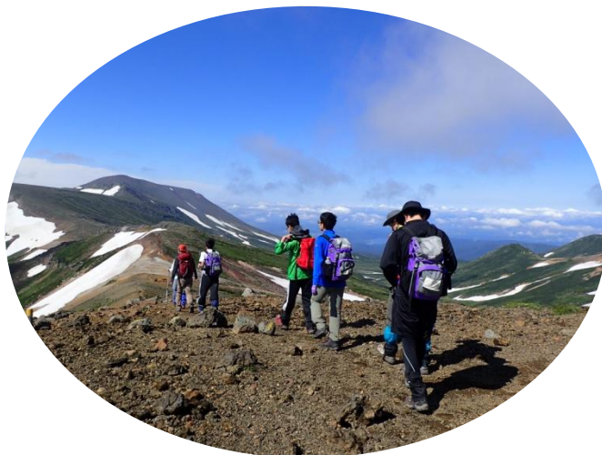
眼前に広がる雄大な風景