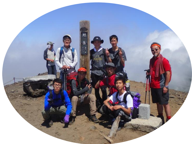
北海道1 高い所で記念写真