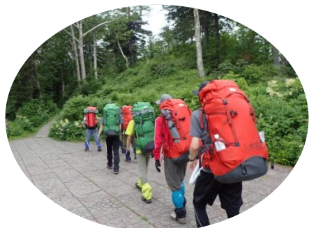
メソグを背負ってスタート

3年生が引退し、新体制がスタートです。今回は2年生1名、1年生5名すべて男子のメンバー構成で夏の大雪山で山中泊を楽しんできました。全員メソグを背負っての山行は初めてでしたが、快調なペースで登りました。初日は生憎の雨模様でしたが、2日目早朝からは快晴に恵まれ、桂月岳からの御来光も2日連続で拝めました。しかも雲の架かり方が違って、2パターン御来光が楽しめました。標高北海道第2位の北鎮岳、第1位の旭岳を登り、お鉢平をぐるりと1周しました。まさにこれぞ北海道と言っても過言ではないどこまでも続く雄大な風景に、部員達も感動の面持ち。花の名前も沢山憶えました。夜は満天の星空。空にはこんなにも沢山の星があったんだね。全員真っ黒に日焼けし、一層遅くなることのできた充実の夏合宿になりました。