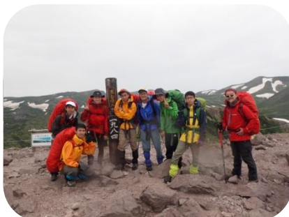
黒岳山頂では雨でした