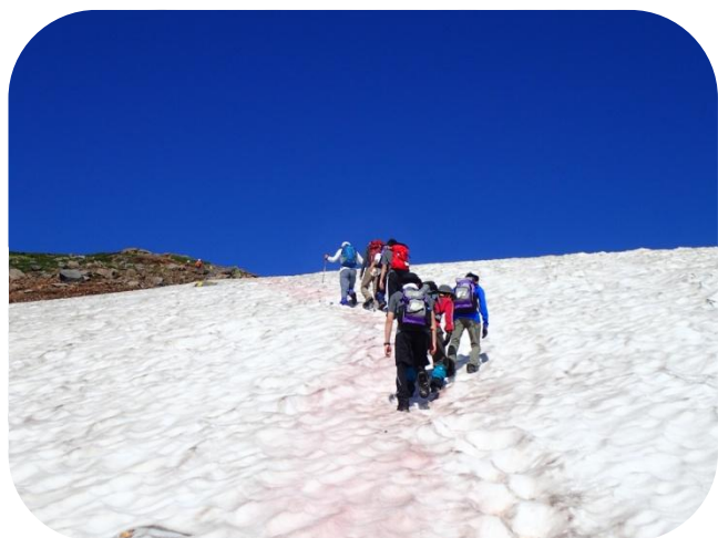
まだ雪溪の残る所もあります