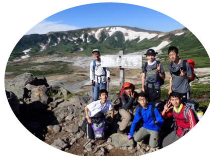
2日目快晴 御鉢平展望台