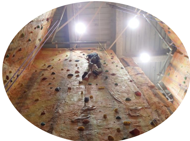
完登までもう少し