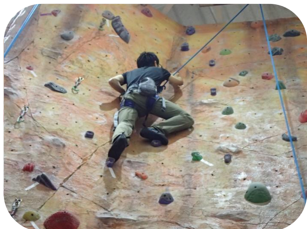
同じ色のホールドを見つけながら上へ