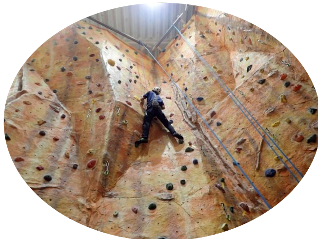
コースには様々な工夫が施されています