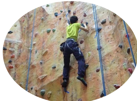
トップ・ロープで安全確保