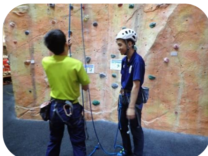
2人組になって練習開始